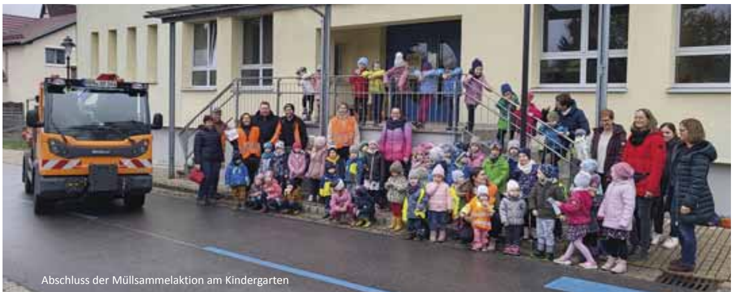
Abschluss der Müllsammelaktion am Kindergarten

Für den Kindergarten Heldburg, Susannes Roth Zusätzliche Fachkraft Sprach-Kita