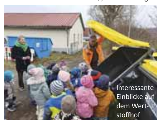
Interessante Einblicke auf dem Wertstoffhof

Die Bibliotheken Hildburghausen und Lichtenfels stellten für uns zahlreiche Sach- und Geschichtsbücher zum Thema bereit. Aus der Regelschule erhielten wir zuverlässige Unterstützung durch Vorleser der 6. Klasse und Lernende der 9. Klasse, die sich im Umgang mit Jüngeren übten. Und auch Bauhof, Mehrgenerationenhaus, Johanner-Tages-