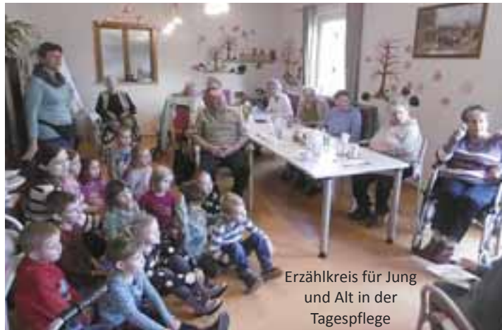
Erzählkreis für Jung und Alt in der Tagespflege

VORLESEN schafft Zukunft: ... für die Entwicklung unserer Kinder, weil es deren Fähigkeiten auf vielfältige Weise fördert. ... für eine gemeinsam gestaltete Zeit, weil es eine tolle Gelegenheit ist, dem Kind Aufmerksamkeit zu schenken. ... für eine lebenswerte Umgebung, weil es die Gesellschaft verbindet und ein Gemeinschaftsgefühl bildet. ... für unseren Kindergarten, weil Vorlesen tagtäglich und gleichzeitig bedeutsam in unserem Haus zelebriert wird.