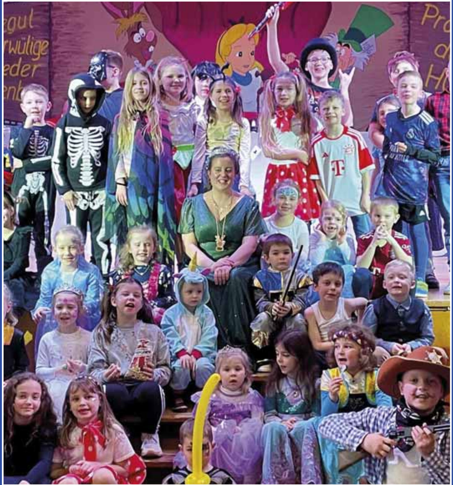
Kinder feierten Fasching in Heldburg am 26.01.2025

Unser Heldburger Heimatland in Wort und Bild