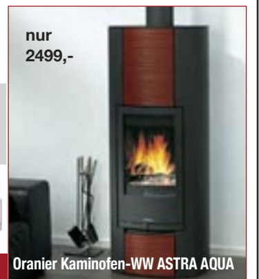
Oranier Kaminofen-WW ASTRA AQUA