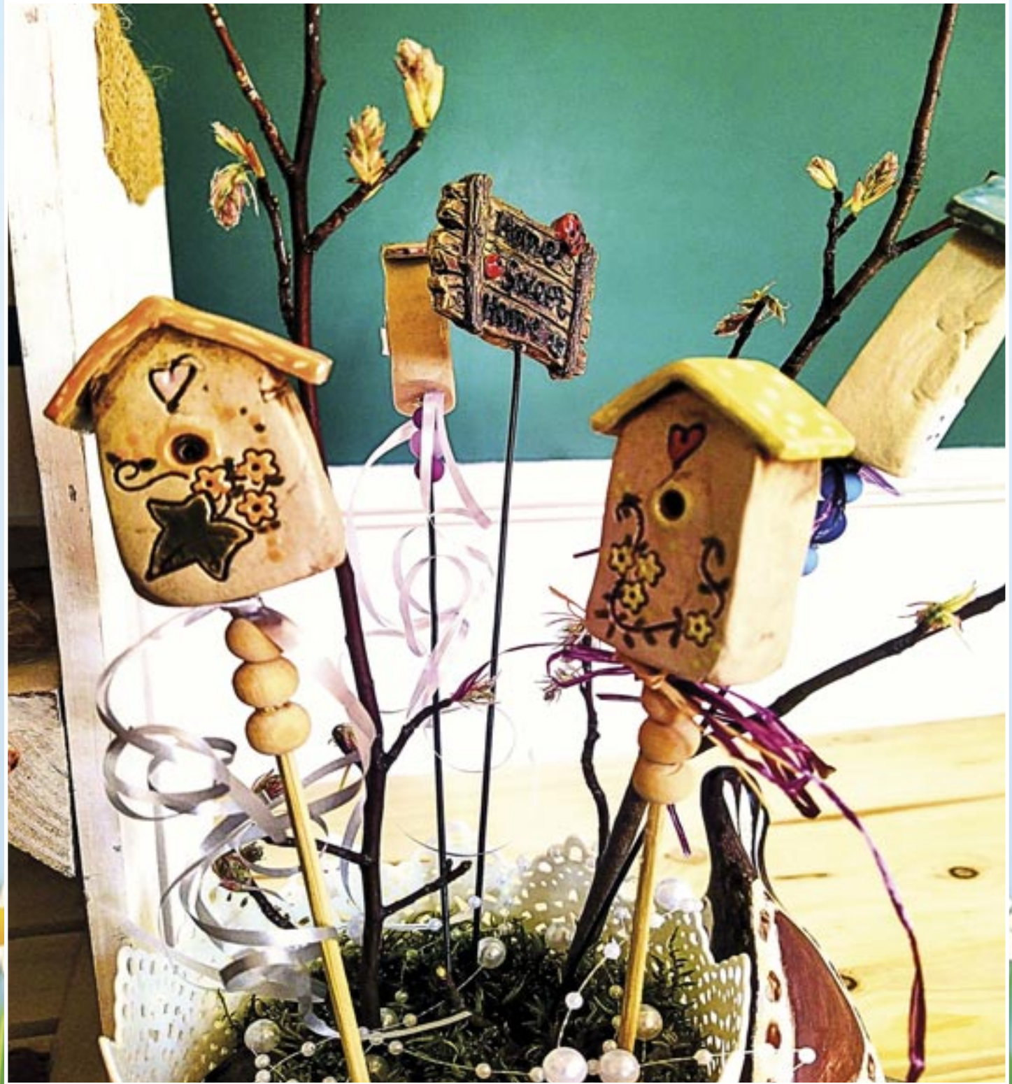
Vogelhäuschen aus Ton von Ramona Fitz, Ostereiermarkt Heldburg 2024, Foto: Melanie Mehrländer-Metzner

Unser Heldburger Heimatland in Wort und Bild