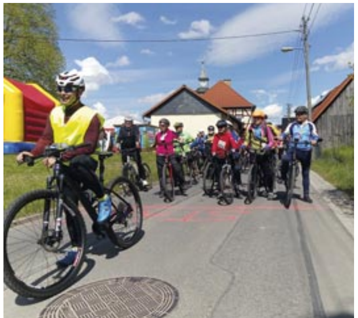
„Bereit zum Start“ – hier beim Anradeln in Birkenfeld im vergangenen Jahr

Seit 2013 findet das Anradeln unter dem Dach der Initiative Rodachtal jährlich am letzten Sonntag im April im Initiativegebiet statt. Die Initiative Rodachtal unterstützt die Veranstaltung sowohl finanziell als auch beim Marketing. Das Anradeln ist eine von weiteren operativen und strategischen Maßnahmen der thüringisch-bayerischen Allianz zur Vermarktung der Freizeitangebote im Rodachtal.