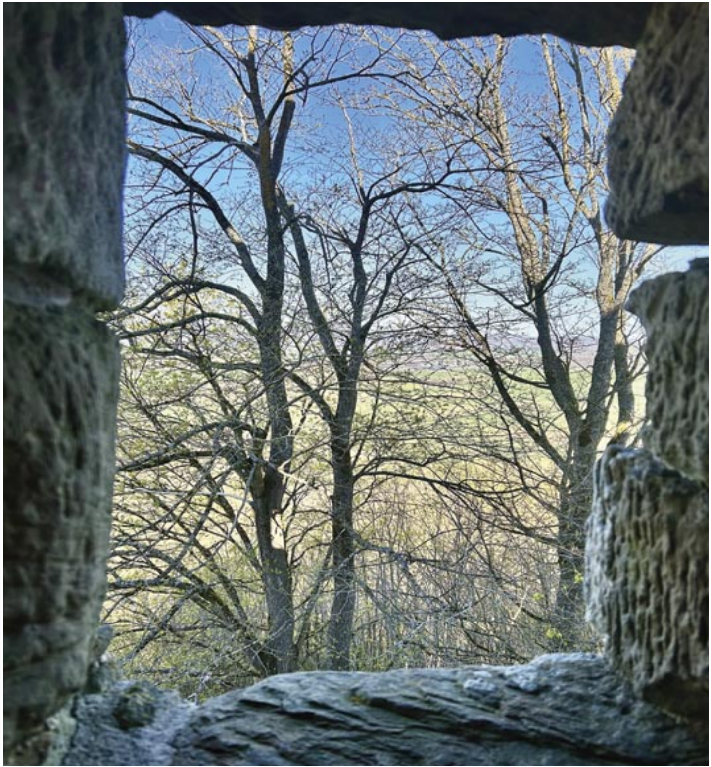
Blick von der Burgruine Straufhain ins Umland im April 2026

Unser Heldburger Heimatland in Wort und Bild