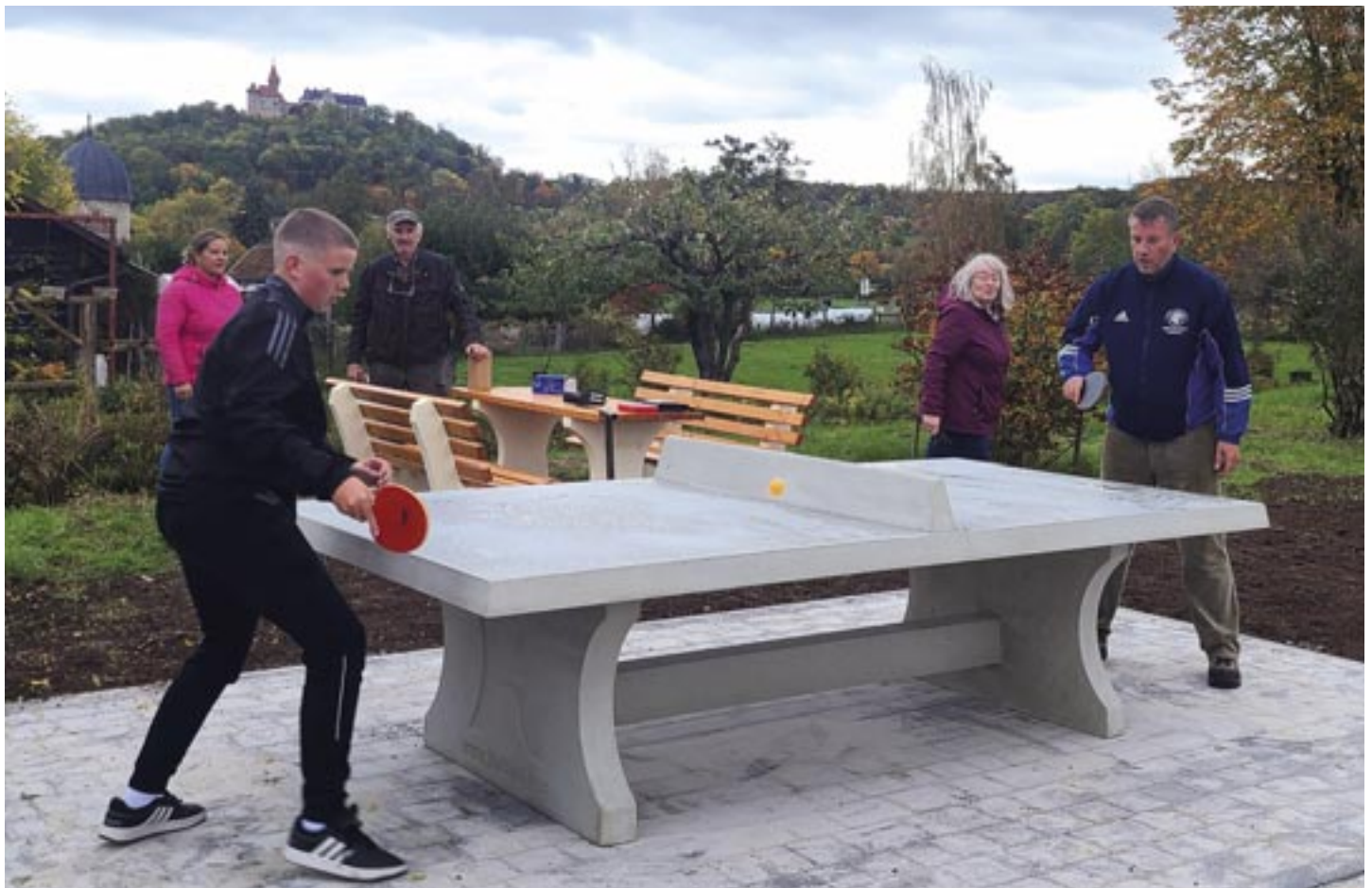
Heldburg - Inzwischen wurden die Arbeiten an der Spielstraße in Heldburg fertig gestellt. Die Tischtennisplatte ist nutzbar und die neu aufgestellte Sitzgruppe lädt zum Verweilen und Zuschauen ein.