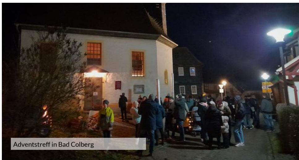
Adventstreff in Bad Colberg

Konzert School Voices HBN 3 - Bis auf den letzten Platz war die Stadtkirche Heldburg beim Weihnachtskonzert des Schulchores des Gymnasiums Hildburghausen besetzt